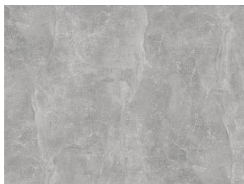
Płyta meblowa laminowana Jasny Atelier 4298 SU Contempo